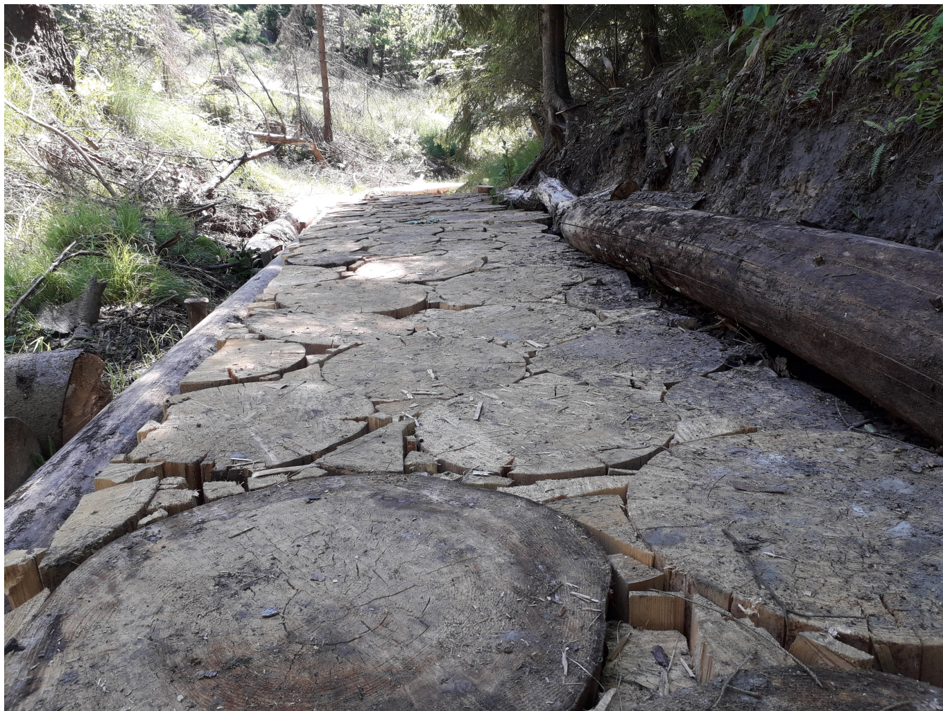
Povalová chodník vytvořená na náhradě, modře značená turistická trase z Mezní Louky do Vysoké Lápy v NP České Á v carsko.