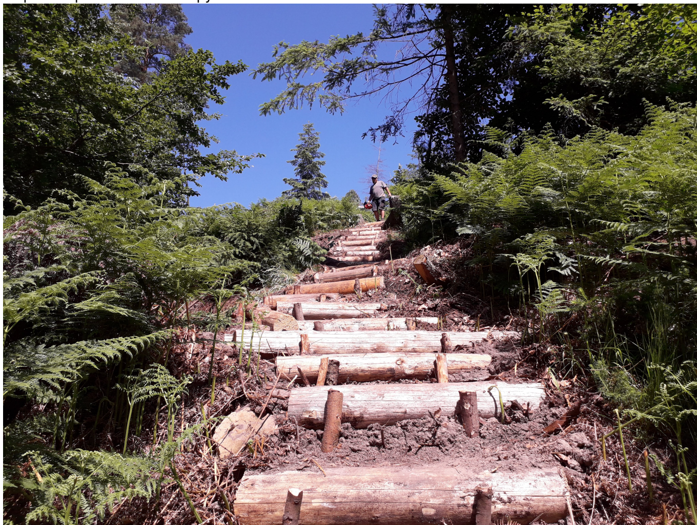
Schody vytvořené na náhradně, modře značené turistické trase z Mezní Louky do Vysoké Lápy v NP České Á½carsko.