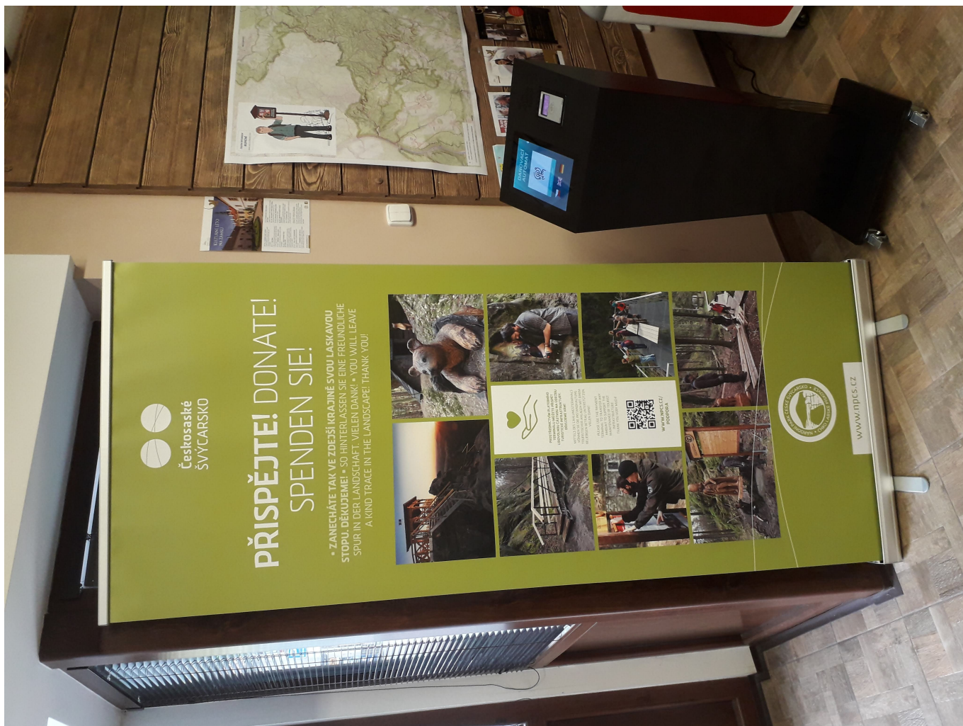
Návštěvníci mohou nově na sbírkových a dějepisných prostřednictvím dárcovského terminálu umístěného v informačním středisku v Jetřichovicích. Foto: Tomáš Salov Foto aktuality