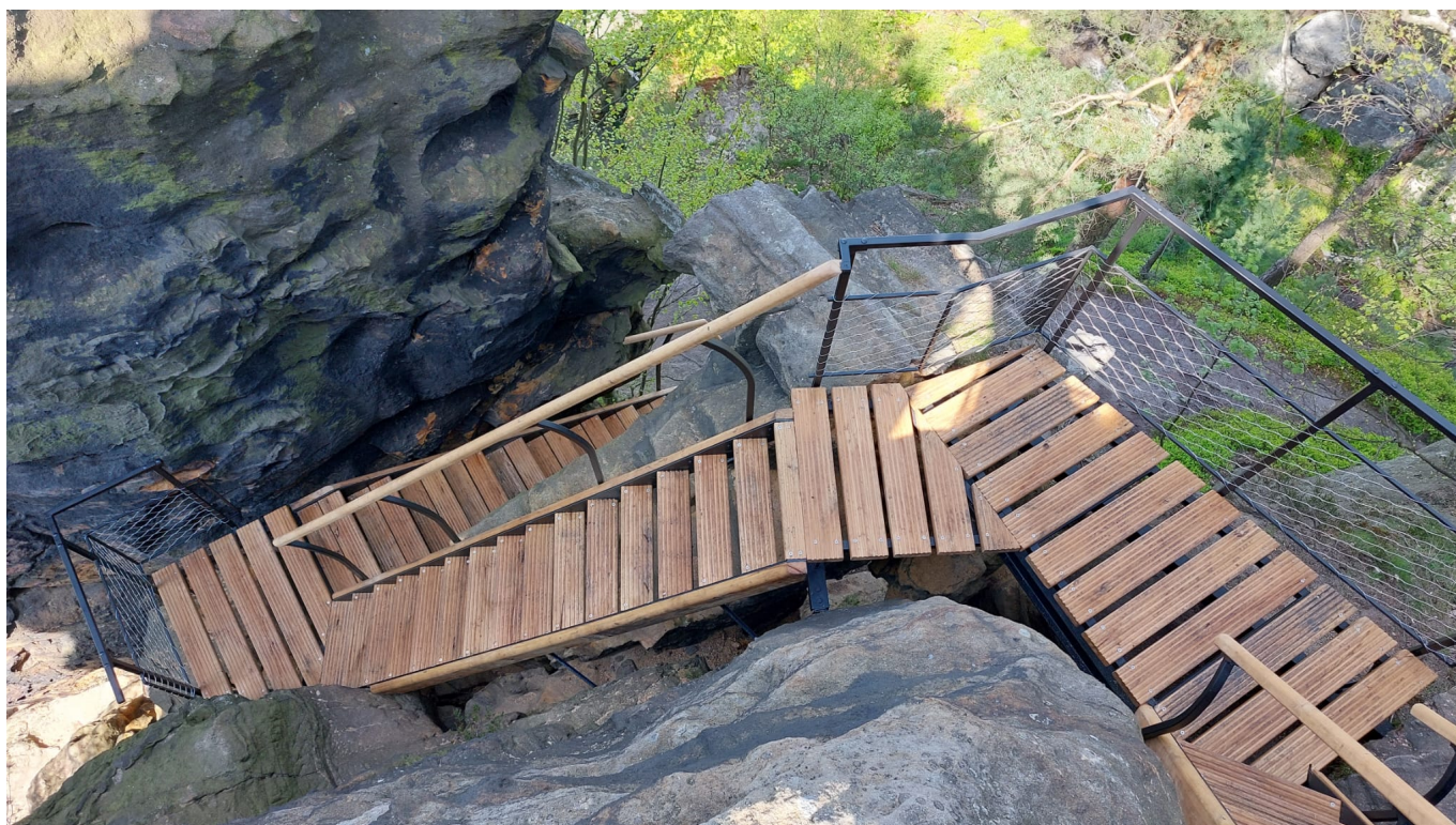
Nové pátupůch žebříky na Rudolfě v kámen.

Postupem času bude správa národního parku věnovat pozornost dalším úsekům pátupůch cest na obě vyhládky. Na pravou souasných pátupůch v úsecích, kdy dochází k vysokému opotřebení skal nebo stávající zábradlí, žebříky a lávky již nesplňovaly bezpečnostní standardy, Správa Národního parku Česká a vládcarsko vynaložila 1,6 mil. Kč bez DPH.