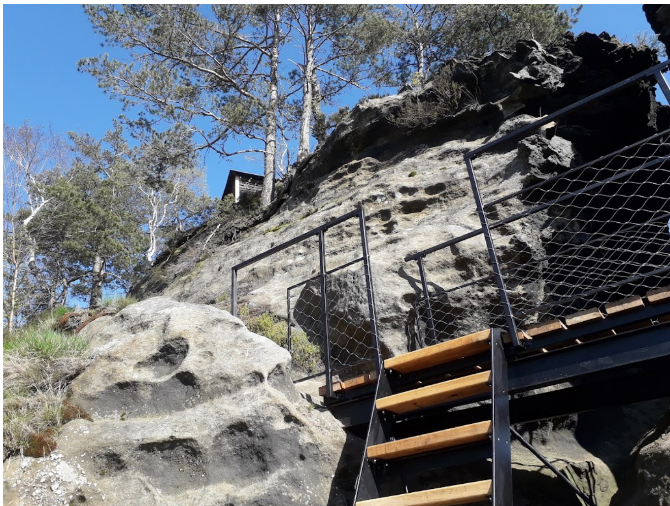
Upravený přístup na Rudolfův kámen.