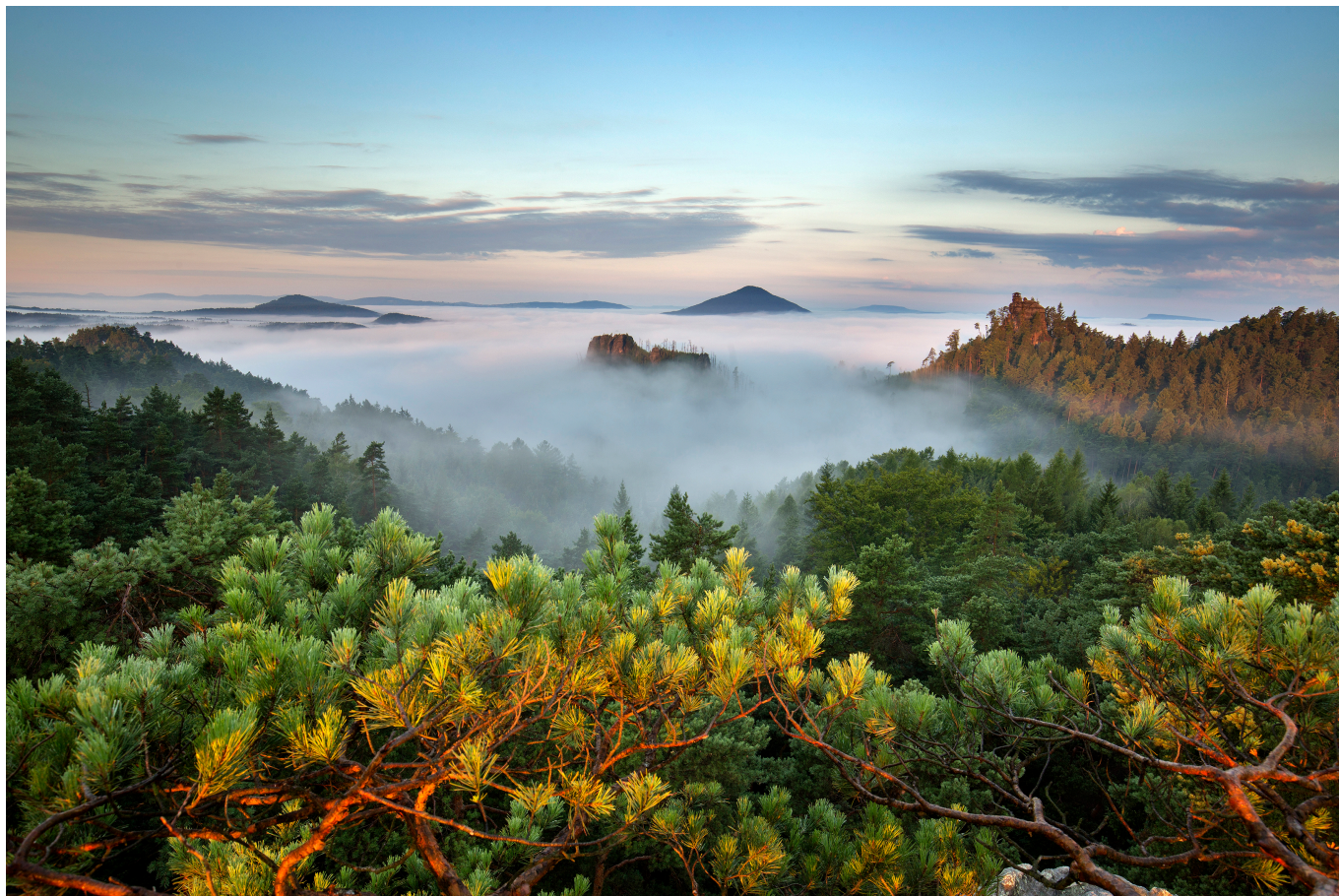
Mariina vyhládká, Havraní skála a Rákosovské vrch v Národném parku Česká a v carsko.