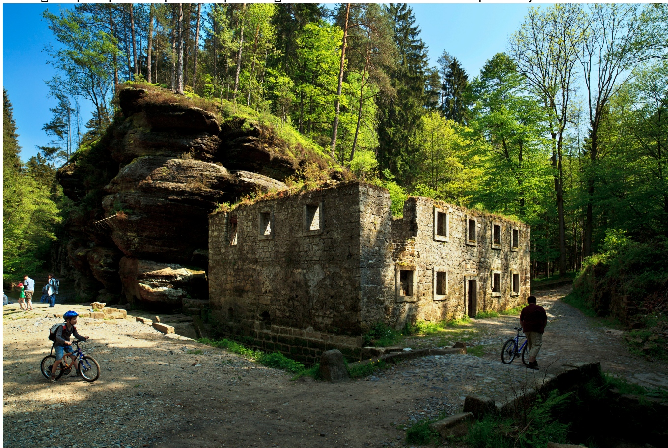
Dolský mlýn v Národném parku Jeseník v 1. carsko.