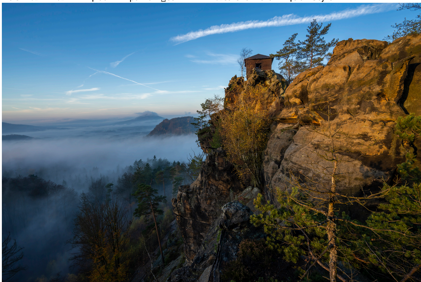
Rudolfův kámen v Národném parku Jeseník v 1. carsko.