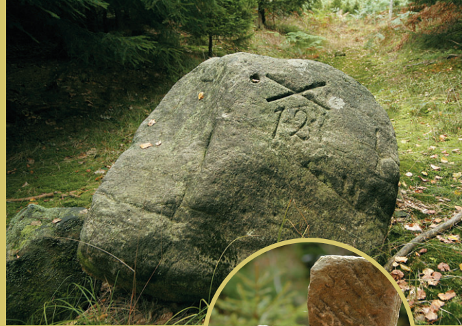
Mezník zv. Lagernummer