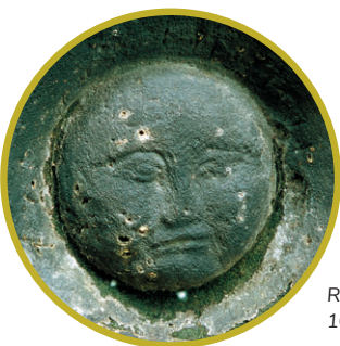
Reliéf luno, pravděpodobně ze 16. stol., Tetřeví stěny u Hřenska