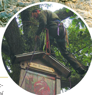
Instalace obrazu sv. Eustacha u lovecké chaty na Jedlině u osady Na Tokání

kteřý hradil všechny obnovy. Ani tato nařízení nedokázala ochránit všechny památky, a tak hodně záleželo na diplomatickém umění konkrétního faráře. Přesto řada objektů získala své patrony a jejich rodiny se o kříže a sochy staraly až do roku 1945. Po konci 2. světové války a odsunu obyvatelstva se péče vrátila zpět do starých kolejí, spoléhající jen na soucit a ochotu dobrovolníků.