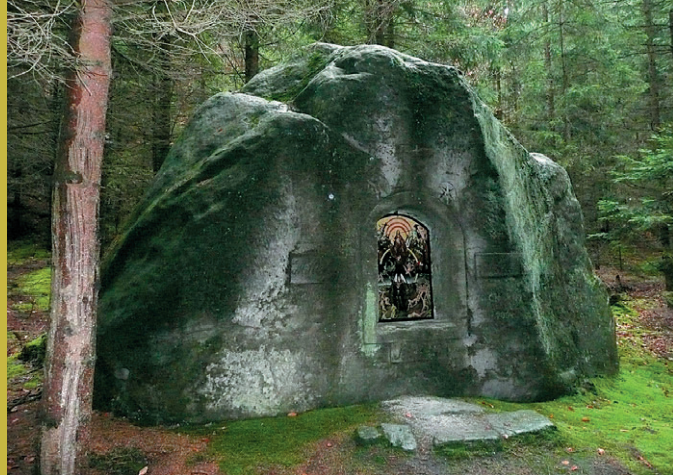
Knyova kaple Posledního soudu u Jetřichovic