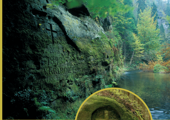
Mezník zv. Lagernummer