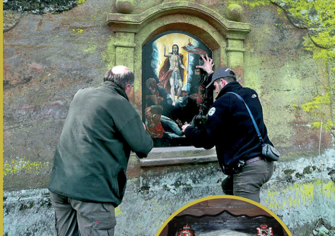
Kaple Vzkříšení Na Potokách, osazování nového obrazu

Trvalo téměř půl století, než se uzdravil vztah novosedlíků ke svému domovu a okolí, a tím byl probuzen i zájem o historii a osudy zachovaných pomníků. V posledních letech se stále častěji odhodlávají jak jednotlivci, tak i spolky a státní instituce k záchraně drobných památek. Pozadu nezůstává ani Správa Národního parku České Švýcarsko; za krátkou dobu své existence dala znovu vzniknout několika již zničeným památkám: dřevěnému kříži Na Tokání, kříži s plechovou malovanou siluetou Krista na Zámeckém vrchu u Vysoké Lípy i obrazům sv. Eustacha u stejnojmenné lovecké chaty na Jedlině, sv. Huberta pod Vosím vrchem, Nejsvětější Trojice na Třípackovém buku