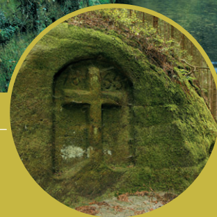
Stübelhannesův kříž u Studeného