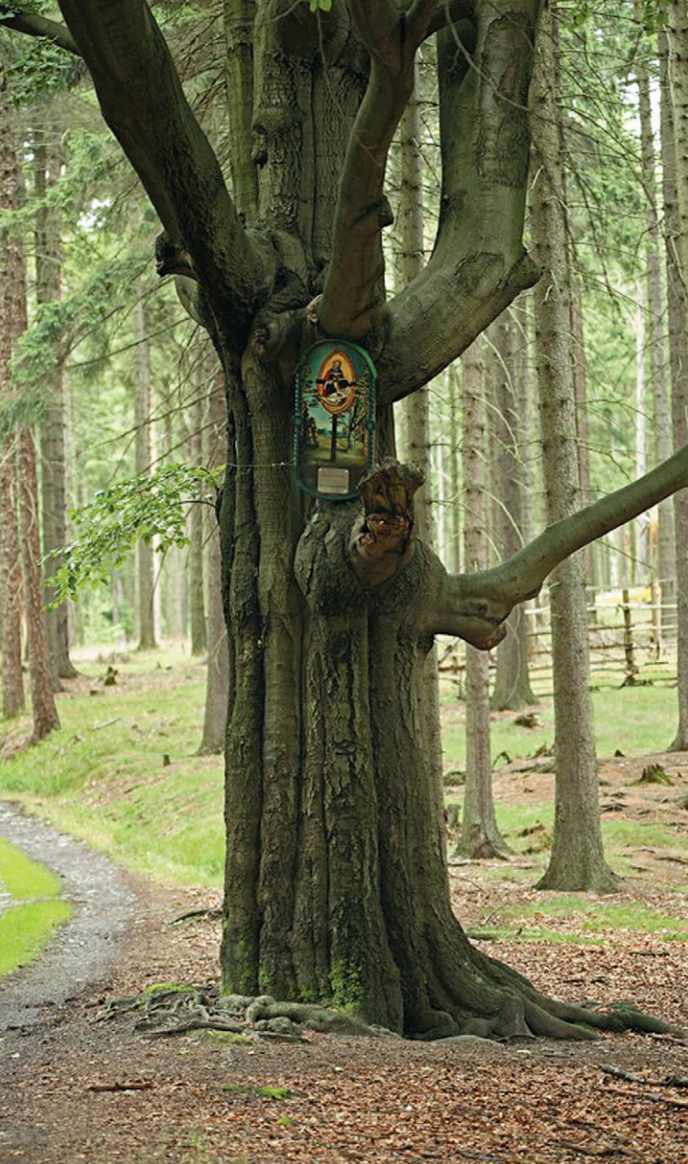
Obraz Nejsvětější Trojice na Třípackovém buku u Doubice