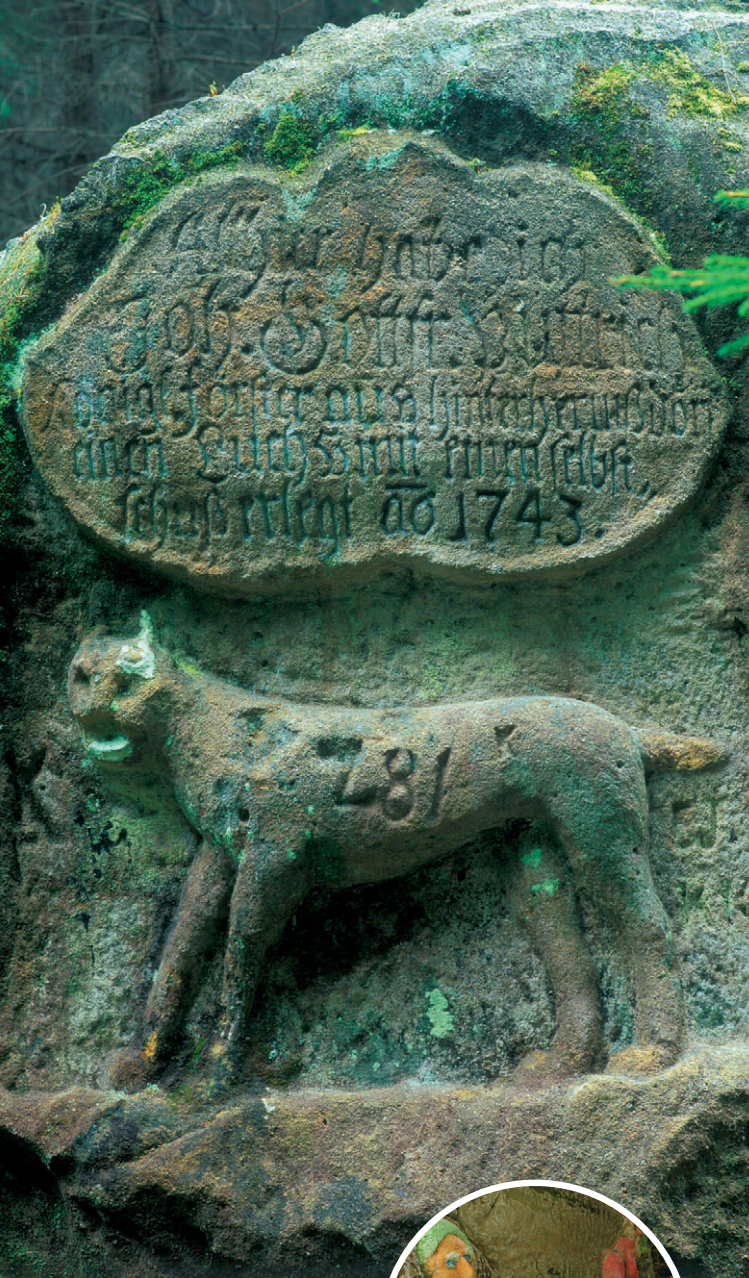
Rysý kámen ve Velkém kozím dole

Trpasličí skála u Rynartic Skalní reliéfy z 3. čtvrtiny 19. století zobrazující pověst o pomoci skrýt-ků staré chudačce Ritschelové, zaklíněné po pádu do skalní trhliny.