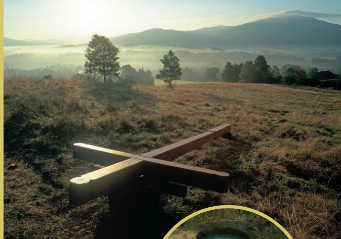
Instalace kříže na Křížovém vrchu u Rynartic