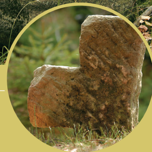
Stübelhannesův kříž u Studeného

ším a nejuprávnějším památkám tohoto druhu patří zemský hraničník u Zadních Jetřichovic – vysekaný reliéf erbu Vartenberků ze 16. století. K právním památkám náleží i objekty spojené s trestním soudnictvím, tzv. smírčí kříže. Drobné kamenné monolitické kříže mají svůj název odvozený od středověkého způsobu řešení vážných trestních provinění. Došlo-li k usmrcení člověka, existovala až do 16. století možnost dohodnout se s žalobcem a odčinit vinu mimosoudní cestou splněním řady podmínek: zaplacením odškodného, vykonáním kající pouti, věnováním vosku do kostela, odsložením stanoveného počtu zádušních mší a kromě toho někdy i vybudováním kamenného kříže na místě skonu. Kamenné kříže, které lze dnes v Českém Švýcarsku ještě spatřit, jsou však již mladšího data – Riedlův kříž mezi Srbskou Kamenicí a Růžovou, Dietzeho kříž na Novém Světě u Růžové, Engelův kříž v Brtníkách i Stübelův pod osadou Studený patří již do kategorie pietních památek.