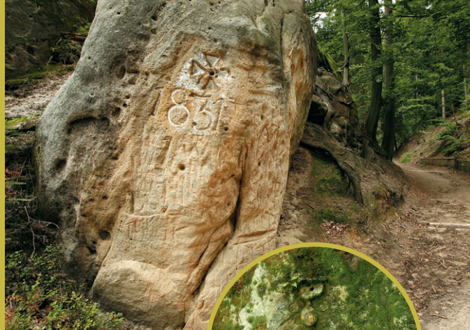
Mezník stabilního katastru, 1831, Jetřichovice