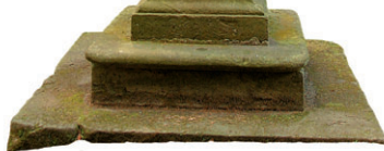
Sloup sv. Antonína u osady Kopec