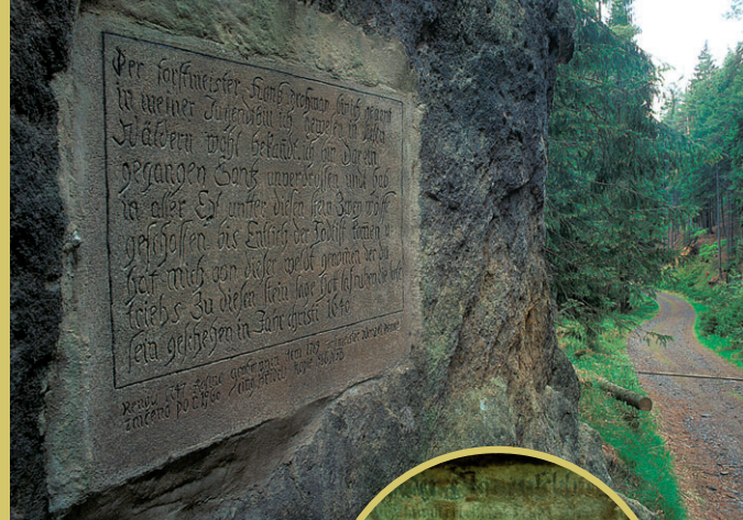
Vlčí deska, katastr zaniklé obce Zadní Doubice