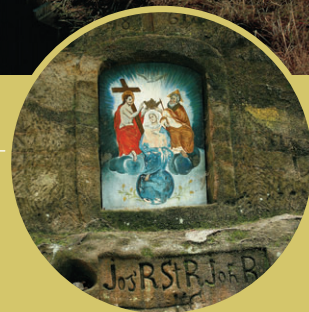
Výklenková kaple Korunování Panny Marie zv. Triefbartel u České silnice mezi Vysokou Lípou a Zadními Jetřichovicemi