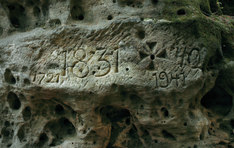
Hraniční značky na Semmelsteinu u České silnice