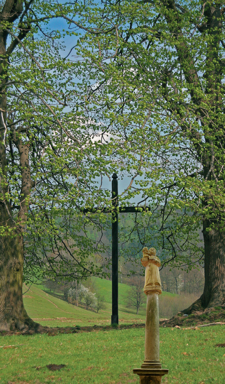
Klingebeckův kříž u Hel